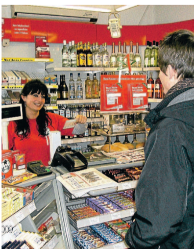
Alkoholtestkauf im Jahr 2009.